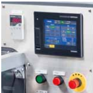
最適な操作性と豊富な表示情報