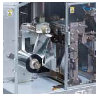
サーマルプリンター(オプション)