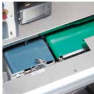
高い生産性を産み出すツインコンベア