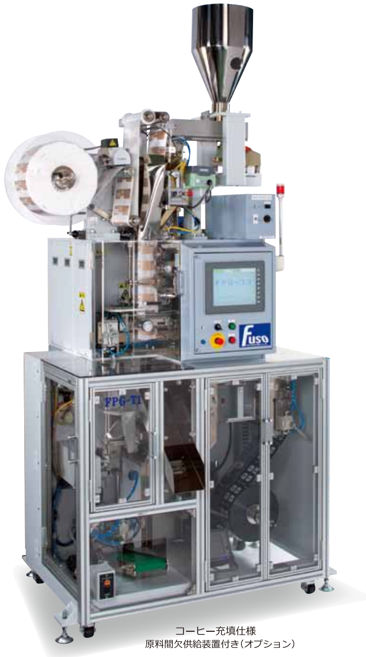
コーヒー充填仕様 原料間欠供給装置付き(オプション)