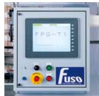
大型タッチパネルによる快適操作