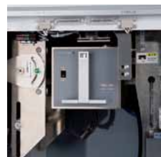
サーマルプリンタ採用(オプション)