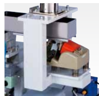
原料間欠供給装置(オプション)