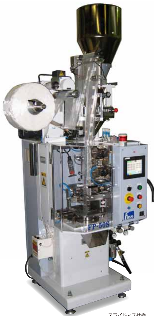
スライドマス仕様