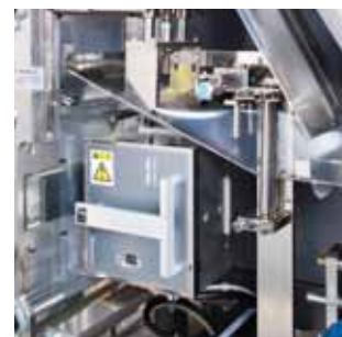
サーマルプリンター(オプション)