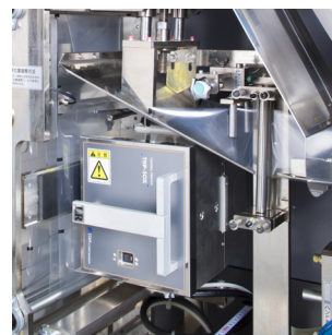
サーマルプリンター(オプション)