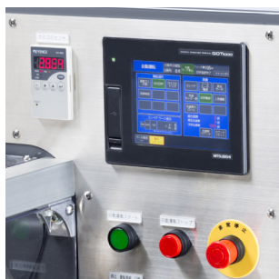
最適な操作性と豊富な表示情報